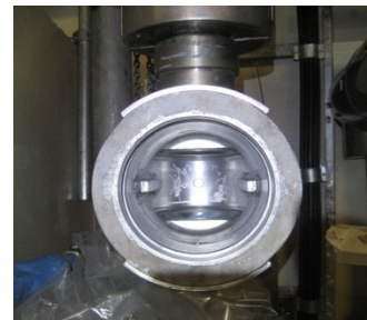
Geöffnete Armatur eines Volumen-Regelsystems nach der Dekontamination