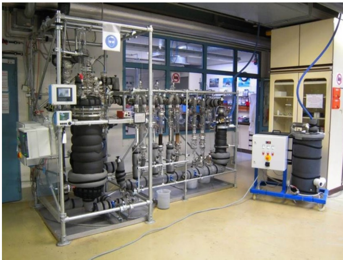
Laborversuche zum Dekontaminationsprozess

Die akkumulierte Personendosis während einer Dekontaminationskampagne liegt im Bereich einiger mSv, aufgrund des Wegfalls externer Komponenten, die keiner Montage bzw. Demontage bedürfen. Das ASDOC-Verfahren erreicht durch die exakte Prozesssteuerung Dekontaminationsfaktoren >75 .